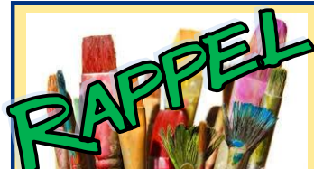
Illustration recherchée pour le planificateur 2019-2020

Afin d'illustrer la couverture de l' Outil de travail quotidien du personnel enseignant pour la prochaine année, nous sommes une fois de plus à la recherche d'une œuvre originale produite par l'une ou l'un de vous, membres du SERM.