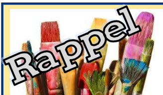
Illustration recherchée pour le planificateur 2019-2020